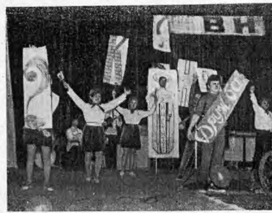
Мы были очень изобретательны, но соперники оказались сильнее нас.

низацию их должны взять на себя комитет ВЛКСМ, студпрофком, факультет общественных профессий.