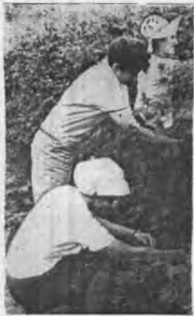
Сладкая работа в малиннике.