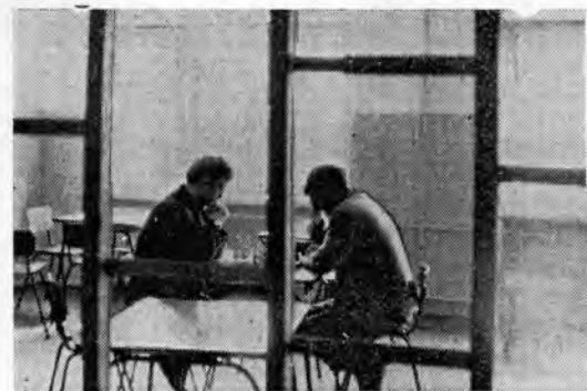
В часы досуга.