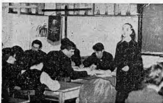
Вот и пришло время подвести итоги конкурса на лучшую академическую группу.