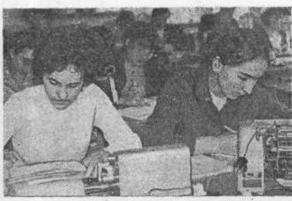
линейками (снимок слева), зато будущие экономисты оснащены счетными машинками, техникой (снимок справа).