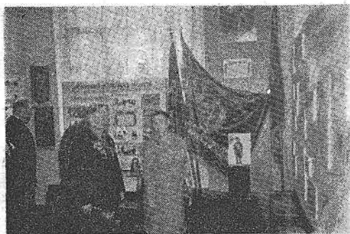
Гости института, ветераны Великой Отечественной войны, в музее.

За год своего существования музей боевой и трудовой славы стал опорным пунктом военно-патриотической работы в нашем институте. О том, насколько успешно он выполняет свои функции, свидетельствует диплом третьей степени, которым награжден наш институт по итогам смотря-конкурса на лучшие музеи вузов