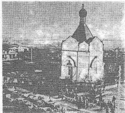
Верхнебазарная площадь (ныне площадь Ленина).