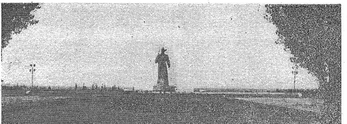
Есть в Ставрополе памятник, который был открыт в честь 50-летия освобождения города от белогвардейцев. Воздвигнут он недалеко от кинотеатра «Родина», на месте, где 210 лет назад была заложена Ставропольская крепость. Шагающий красноармеец... Это память о тех, кто в годы гражданской войны самоотверженно сражался за установление Советской власти.