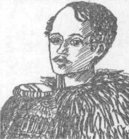
М. Ю. ЛЕРМОНТОВ (1814 — 1841 гг.)