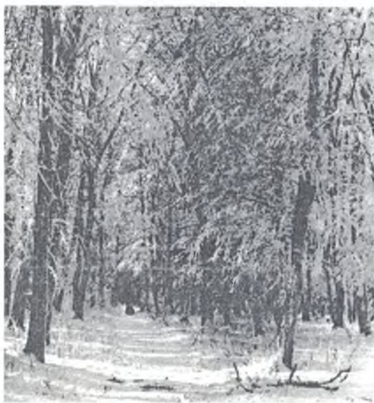
«Чарадейкою зимою околданан лес стоит»

Нельзя не сказать и о том, что хозяева Игр «отличались» в делах, ни со спортом, ни с олимпийским движением ничего общего не имеющих. Организаторы Олимпиады пытались устроить так называемые «антропологические дни», когда бы состязались только «цветные спортсмены». Но попытки эти кончились провалом. Основатель Игр Пьер де Кубертэн резко осудил расистов. С подобными предложениями из Олимпийских игр с тех пор уже больше никто не выступал.