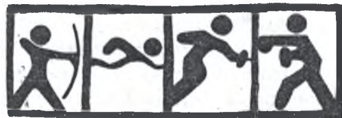
Рис. Н. БОЛДЫРЕВОЙ.

Адрес редакции: 355014, г. Ставрополь, ул. Мира, 347, к. 119, тел. 4-58-19